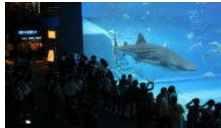
美ら海水族館 ジンバイザメ

2日目は、美ら海水族館、ひめゆりの塔、旧海軍司令部壕を見学し、沖縄アウトレットモールあしびなー、国際通りで班別自主研修を行いました。