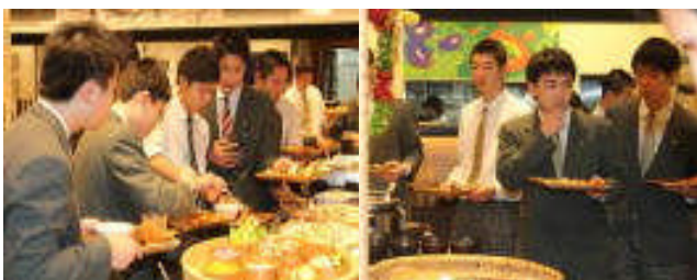
自然食バイキング