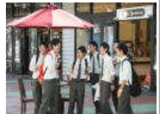
アウトレットモールあしびなー