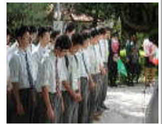
ひめゆりの塔 黙祷