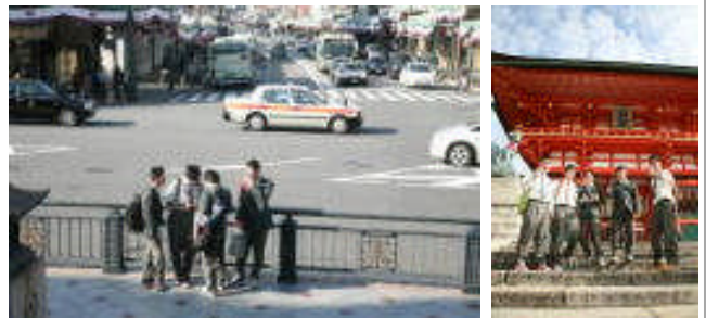
祇園交差点 (班別自主研修)