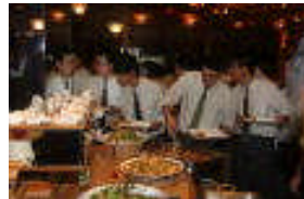
沖縄料理バイキング