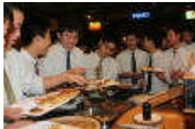
沖縄料理バイキング