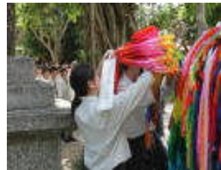
ひめゆりの塔 千羽鶴献納