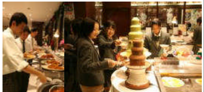
京料理バイキング