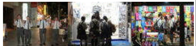
国際通り(班別自主研修)