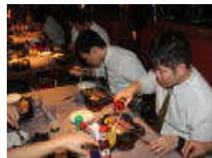
ステーキレストラン