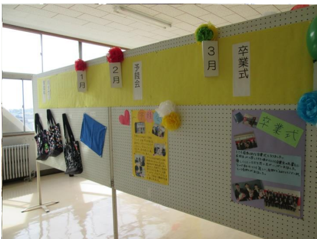
〈家庭の授業で作ったトートバッグ〉