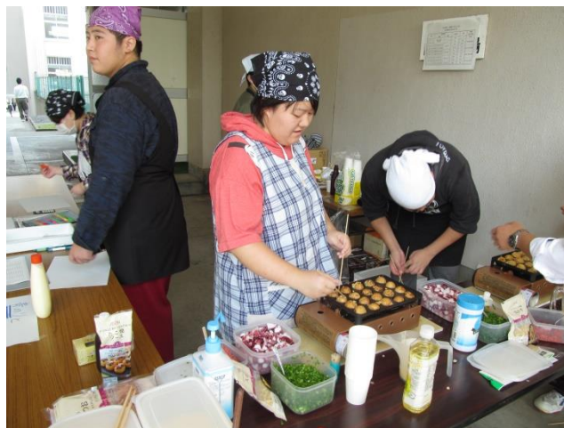
〈始めからうまくできました〉