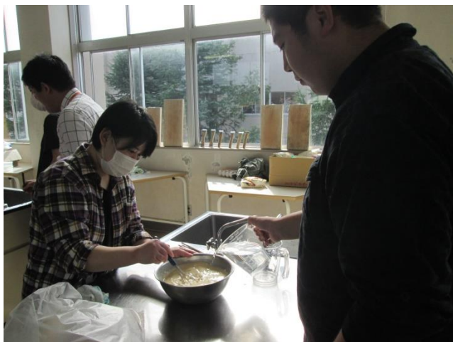
〈たこ焼きの生地作り〉

○10月2日（日）本校にて工業祭を行いました。定時制は縁日でたこ焼きとチョコバナナ、展示では定時制の学校行事1年間をまとめました。