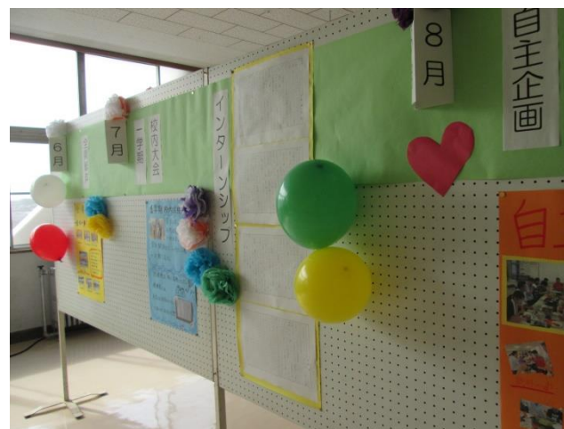
〈行事を生徒が個性的にまとめました〉