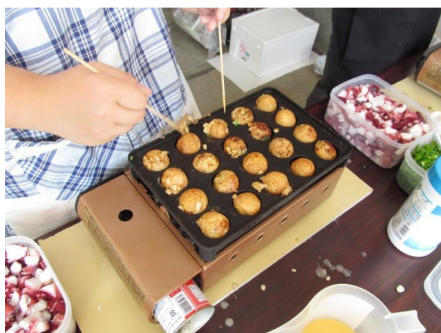
〈大きいたこが入ったたこ焼き完売〉